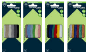
Fils de coton de différentes couleurs