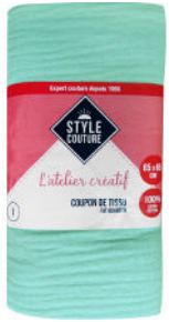
2 coupons de tissu double gaze de coton 65 x 65 cm