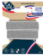
1 élastique paillettes MIF 15 cm x 1,5m