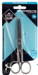
1 paire de ciseaux