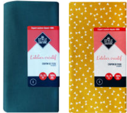
2 coupons de tissus en coton 75 x 75 cm