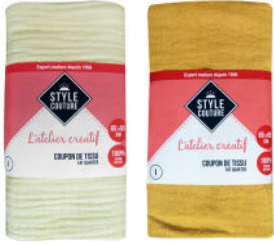
2 coupons de tissu en double gaze de coton 65 x 65 cm